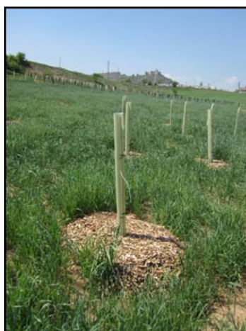
Aspecto de la plantación en el año 0