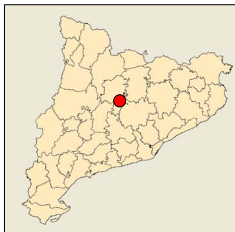
Localización de la plantación